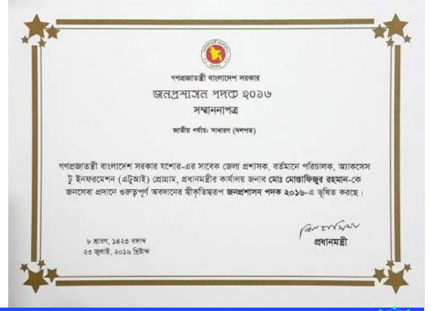
জনসেবায় বিশেষ অবদানের স্বীকৃতিস্বরূপ তিনি ২০১৬ সালে প্রশাসনের সর্বোচ্চ সম্মাননা জনপ্রশাসন পদক অর্জন করেন।