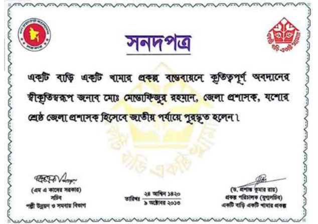
মাননীয় প্রধানমন্ত্রীর অগ্রাধিকারভুক্ত “একটি বাড়ি একটি খামার” প্রকল্পে অনন্য অবদানের জন্য তিনি ২০১৩ সালে শ্রেষ্ঠ জেলা প্রশাসক পদকে ভূষিত হন।