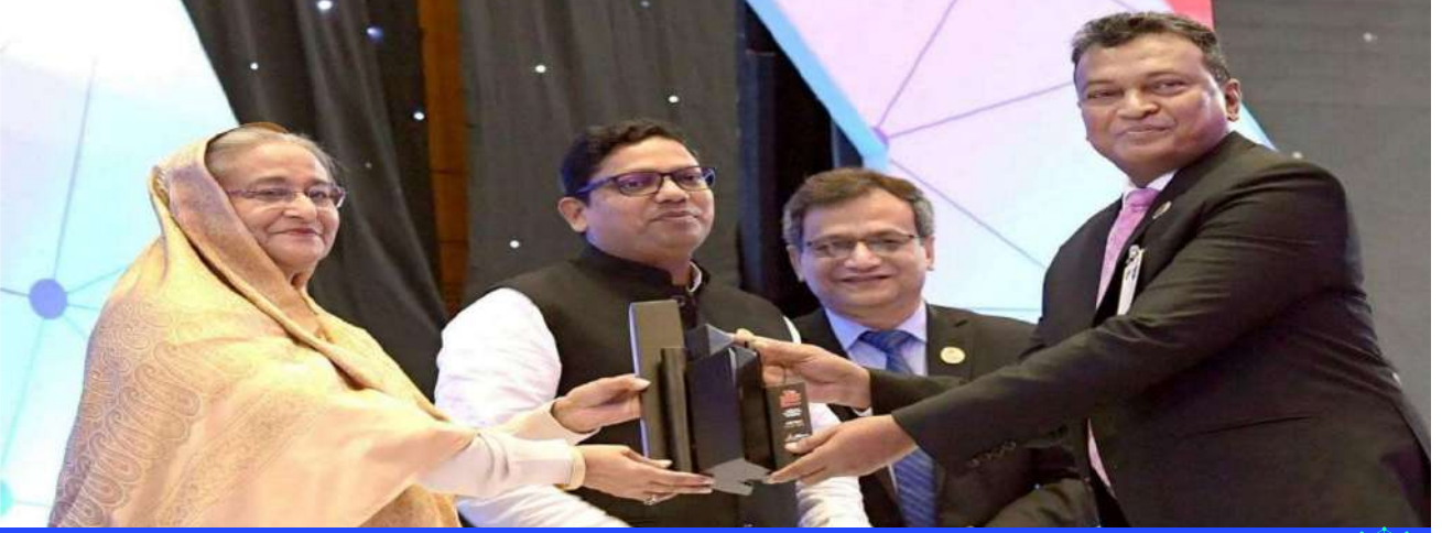
সিলেট বিভাগের বিভাগীয় কমিশনার থাকাকালীন তাঁর সুযোগ্য নেতৃত্বে সিলেট বিভাগ জাতীয় ডিজিটাল বাংলাদেশ দিবস-২০১৯ এ শ্রেষ্ঠ বিভাগের পুরস্কার অর্জন করে।