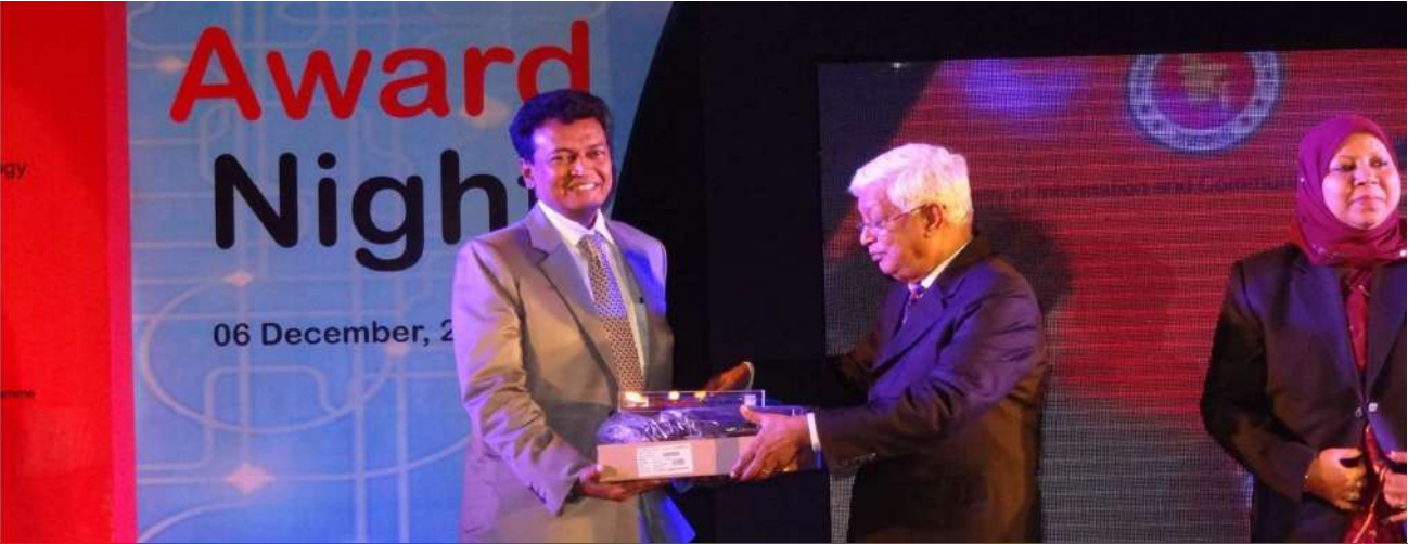
তিনি UISC Sustainability বিষয়ে ২০১২ সালে শ্রেষ্ঠ জেলা প্রশাসক নির্বাচিত হন।