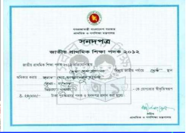
তিনি শ্রেষ্ঠ জেলা প্রশাসক হিসেবে ২০১২ সালে জাতীয় প্রাথমিক শিক্ষা পদক প্রাপ্ত হন।