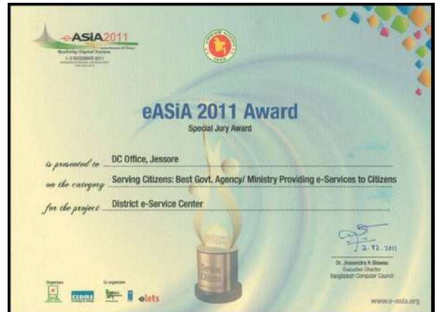
তঁর সুযোগ্য নেতৃত্বে জেলা প্রশাসকের কার্যালয়, যশোর ২০১১ সালে Electronic Asia Award অর্জন করে।